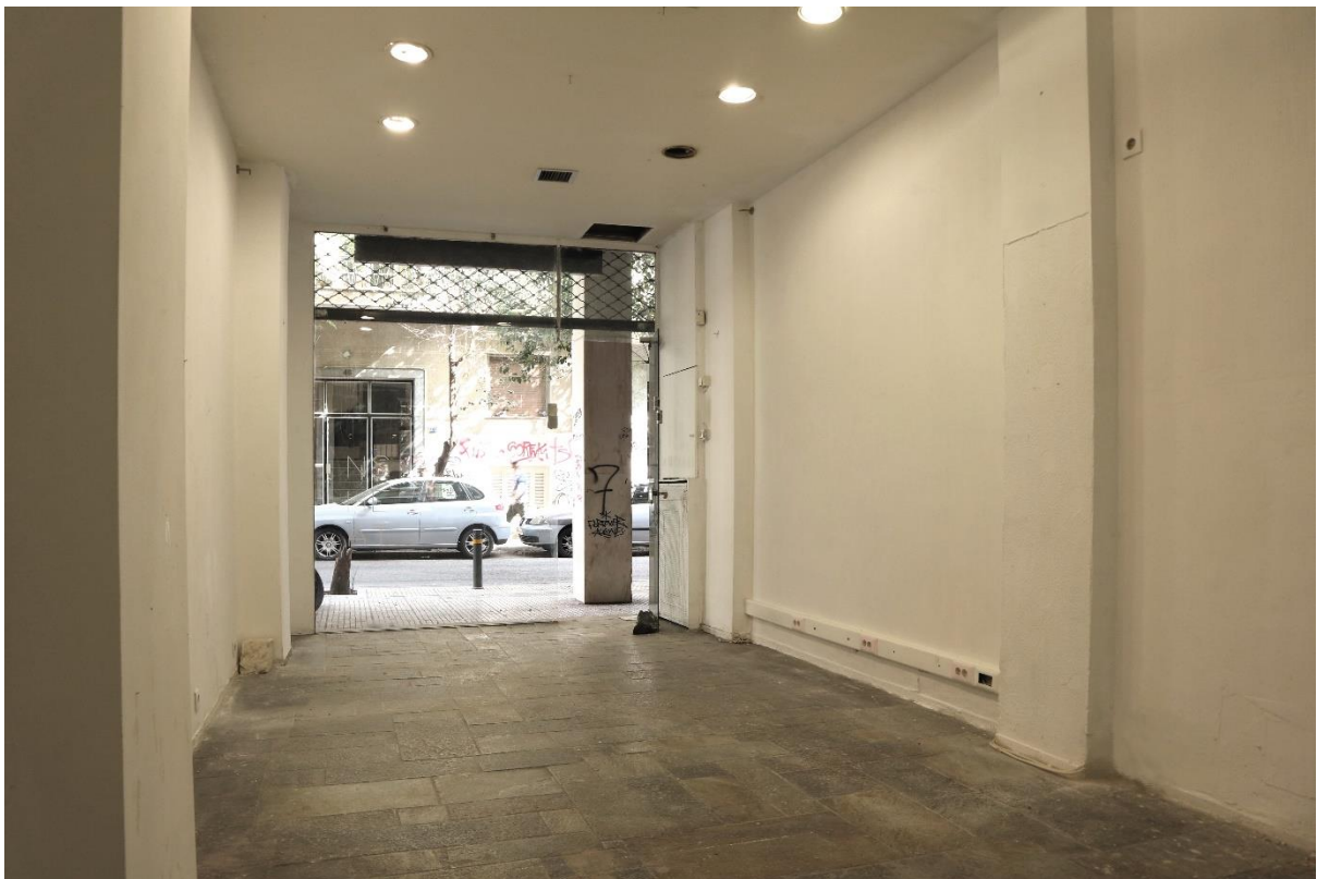
Snehta Mariya space